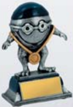
PS615 12 см <BR>