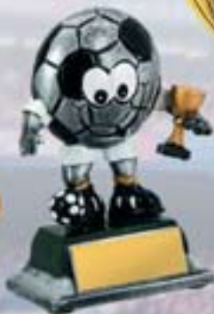
PS614 12 см <BR>