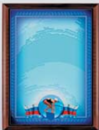
PL316a 31x23 см <CR> PL316b 20,5x15,5 см <CG> ПЛАВАНИЕ