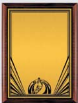
PL324a 31x23 см <CU> PL324b 26x20,5 см <CQ> PL324c 23x18 см <CM> БАСКЕТБОЛ