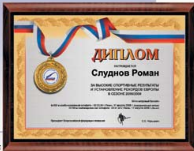
PL333a 23x31 см —В <CS> PL333b 15,5x20,5 см —В <CH>