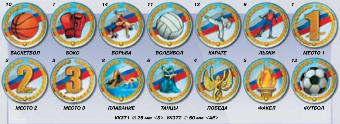
10 БАСКЕТБОЛ 7 БОКС 14 БОРЬБА 11 ВОЛЕЙБОЛ 13 КАРАТЕ 9 ЛЫЖИ 1 МЕСТО 1 2 МЕСТО 2 3 МЕСТО 3 8 ПЛАВАНИЕ 6 ТАНЦЫ 4 ПОБЕДА 5 ФАКЕЛ 12 ФУТБОЛ VK371 Ø 25 мм <S>, VK372 Ø 50 мм <AE>