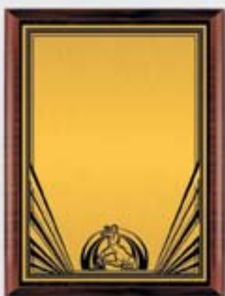
PL325a 31x23 см <CU> PL325b 26x20,5 см <CQ> PL325c 23x18 см <CM> БОРЬБА