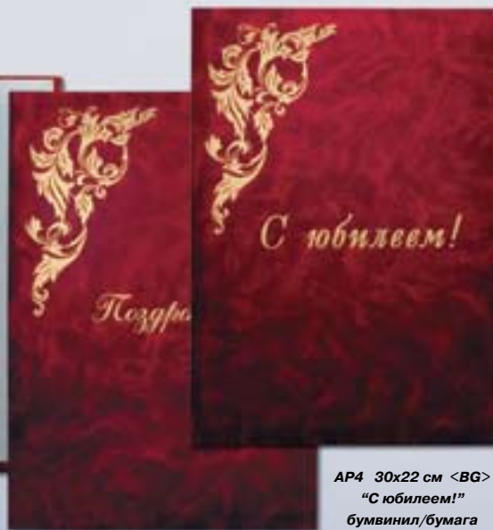
AP3 30x22 см <BG> "Поздравляем!" бумвинил/бумага