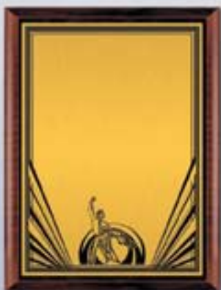
PL329a 31x23 см <CU> PL329b 26x20,5 см <CQ> PL329c 23x18 см <CM> ТАНЦЫ