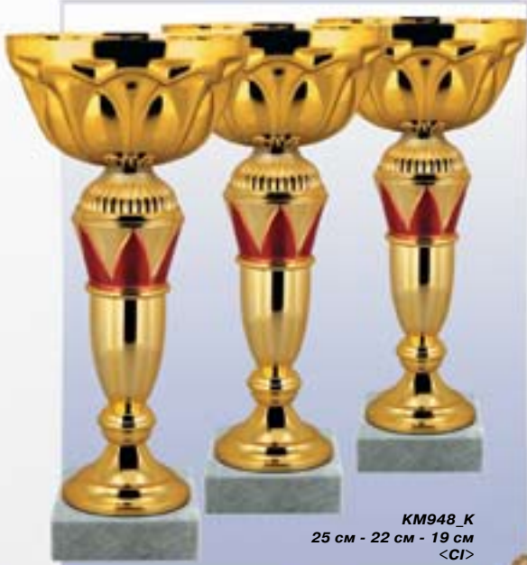
KM948_K 25 см - 22 см - 19 см <CI>

Комплект состоит из трех кубков БЕЗ ПЛАСТИН С НАНЕСЕНИЕМ После обозначения указаны высоты кубков и цена комплекта