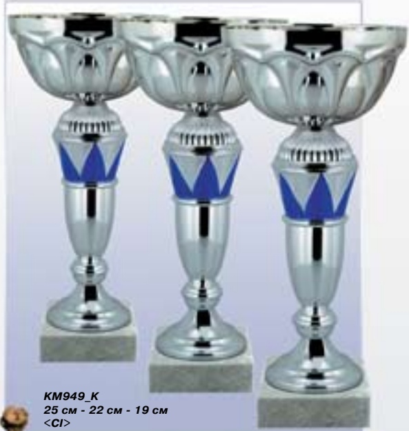
KM949_K 25 см - 22 см - 19 см <CI>