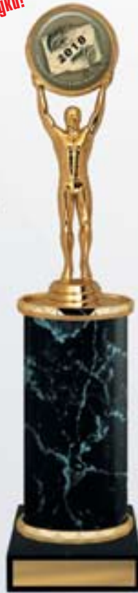
PS609a 34,5 см -A <CA> PS609b 32,5 см -A <BZ> PS609c 30,5 см -A <BY>