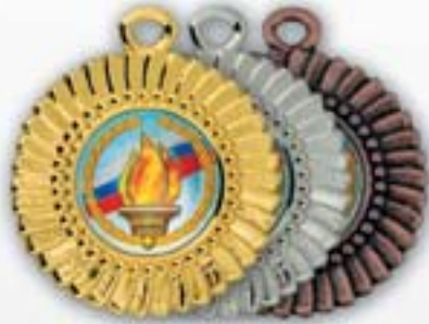
МК165а МК165б МК165с Ø 50 мм <AI> Медаль под вкладыш Ø 25 мм