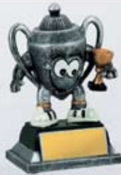
PS617 12 см <BR>