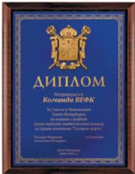
PL311a 31x23 см <CX> PL311b 26x20,5 см <CT> герб Санкт-Петербурга