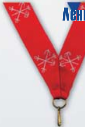
LN22 Санкт-Петербург <AB>