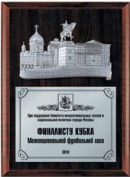
PL308 31x23 см <DB> коллаж "Москва"

Расположение элементов изображения бесплатно