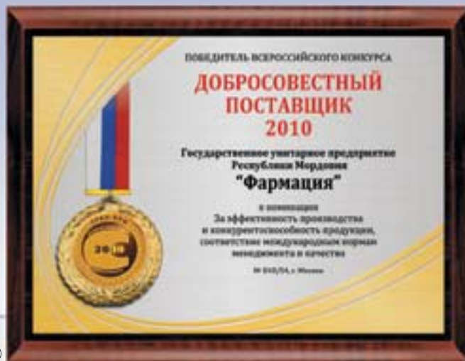
PL334a 23x31 см —А <CS> PL334b 15,5x20,5 см —В <CH>