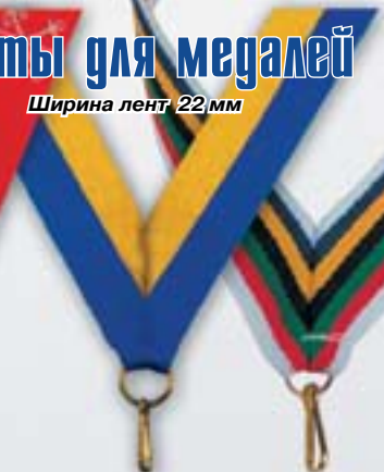
LN20 украинская <W>