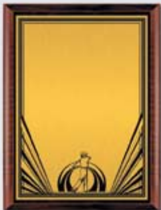
PL327a 31x23 см <CU> PL327b 26x20,5 см <CQ> PL327c 23x18 см <CM> ГОЛЬФ