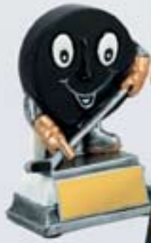
PS616 12 см <BR>