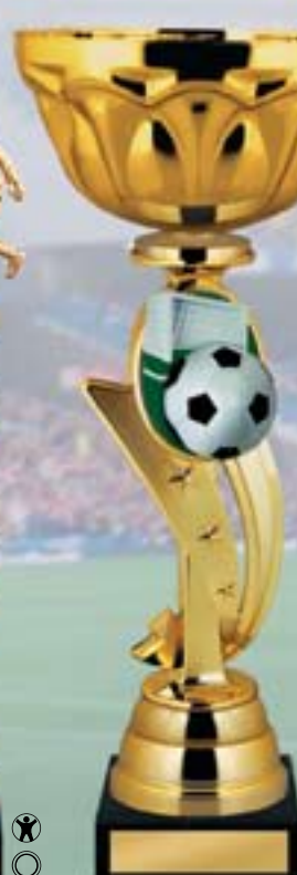
KM950a 34 см <CE> KM950b 32 см <CD> KM950c 30 см <CB>