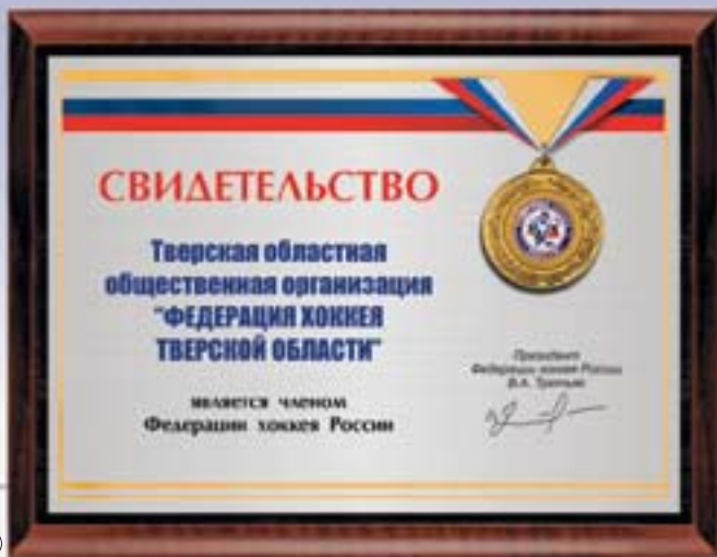
PL321a 23x31 см —В <CS> PL321b 15,5x20,5 см —В <CH>