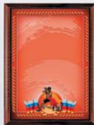
PL313a 31x23 см <CR> PL313b 20,5x15,5 см <CG> БОРЬБА