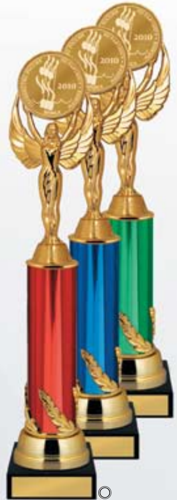
PS618a 37 см -A <CB> PS618b 35 см -A <CA> PS618c 33 см -A <BZ>