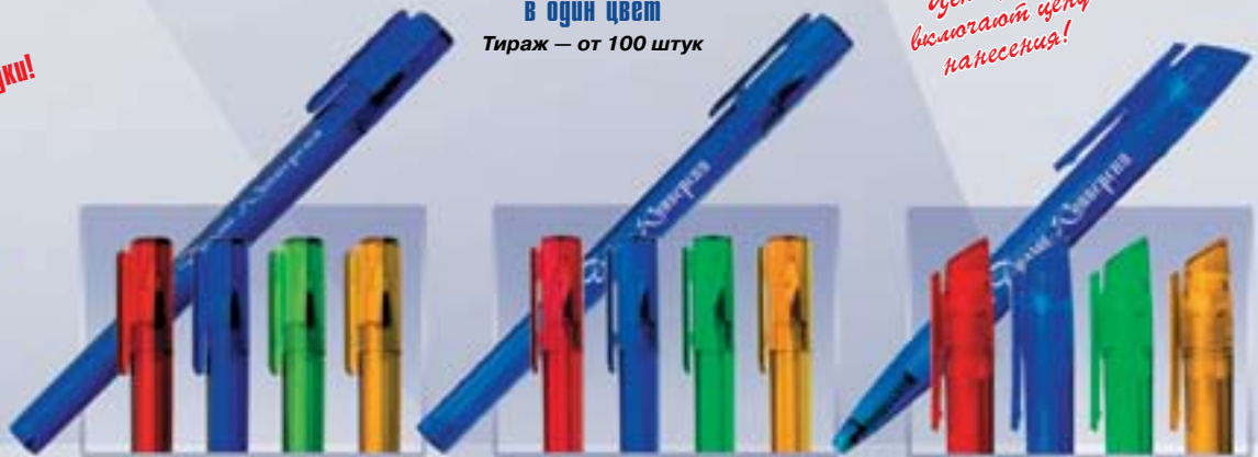
RK45a RK45b RK45c RK45d <AK> треугольного сечения