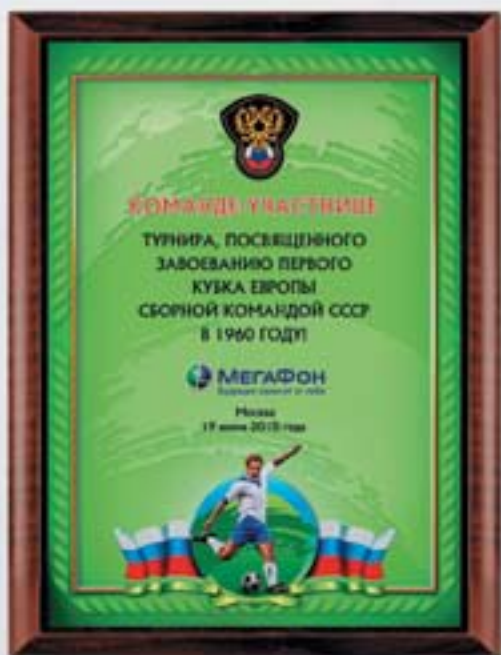
PL319a 31x23 см <CR> PL319b 20,5x15,5 см <CG> ФУТБОЛ