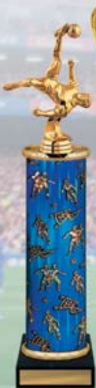
PS605a 40 см -5 <CA> PS605b 38 см -5 <BZ> PS605c 36 см -5 <BY>