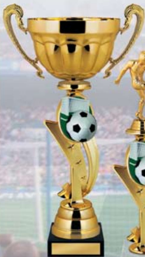
KM940a 38,5 см <CM> KM940b 36,5 см <CL> KM940c 34 см <CK>