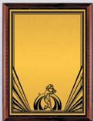
PL330a 31x23 см <CU> PL330b 26x20,5 см <CQ> PL330c 23x18 см <CM> ТЕННИС