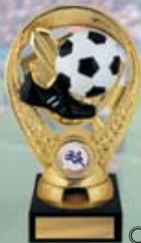
PS612 15,5 см —В <BN>