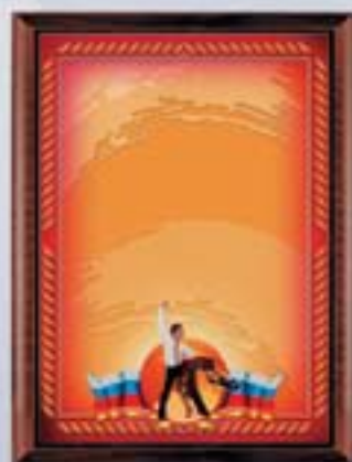
PL317a 31x23 см <CR> PL317b 20,5x15,5 см <CG> ТАНЦЫ