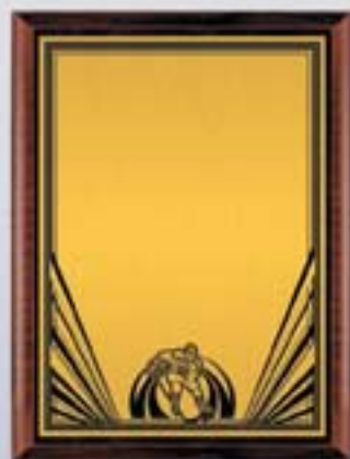
PL332a 31x23 см <CU> PL332b 26x20,5 см <CQ> PL332c 23x18 см <CM> ХОККЕЙ