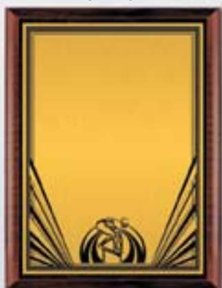
PL328a 31x23 см <CU> PL328b 26x20,5 см <CQ> PL328c 23x18 см <CM> ПЛАВАНИЕ