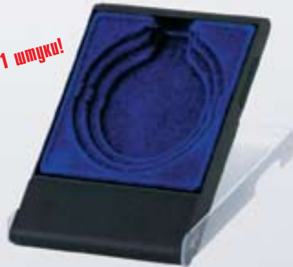
FU107 <AP> футляр для медалей Ø 50/60/70 мм пластик/флок