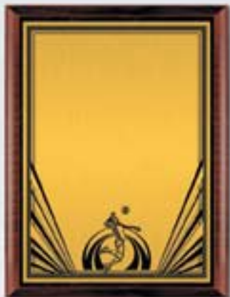
PL326a 31x23 см <CU> PL326b 26x20,5 см <CQ> PL326c 23x18 см <CM> ВОЛЕЙБОЛ