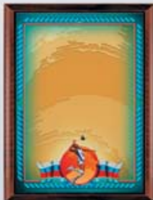
PL314a 31x23 см <CR> PL314b 20,5x15,5 см <CG> ВОЛЕЙБОЛ