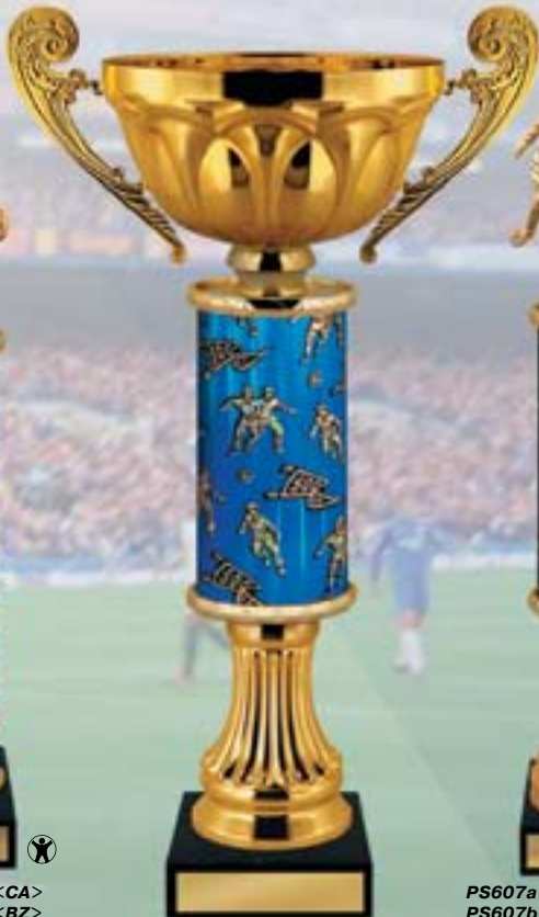
KM939a 46 см <CQ> KM939b 44 см <CP> KM939c 40,5 см <CM>