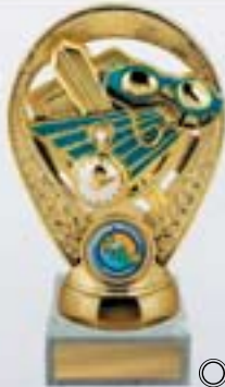
PS611 15,5 см -B <BN>