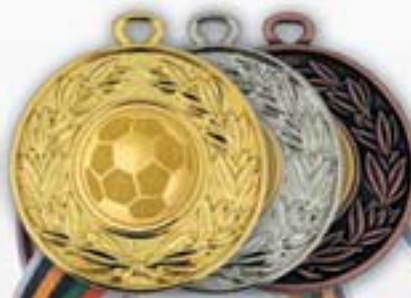
МК166а МК166б МК166с Ø 50 мм <AI> Медаль под вкладыш Ø 25 мм