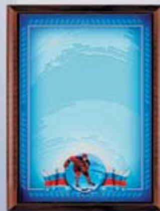
PL320a 31x23 см <CR> PL320b 20,5x15,5 см <CG> ХОККЕЙ