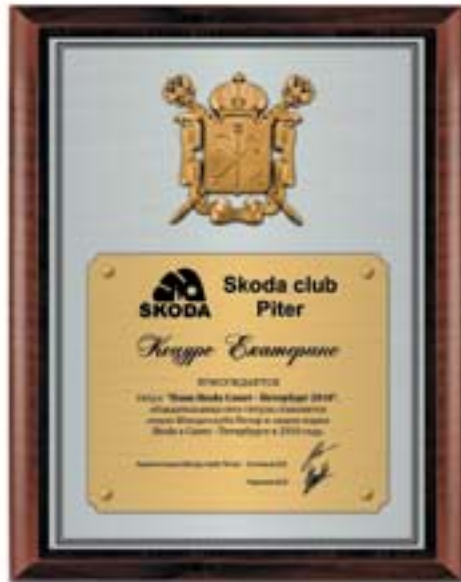
PL310a 31x23 см <DB> PL310b 26x20,5 см <CZ> герб Санкт-Петербурга