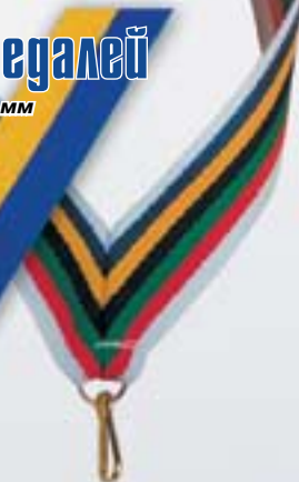
LN21 олимпийская <W>