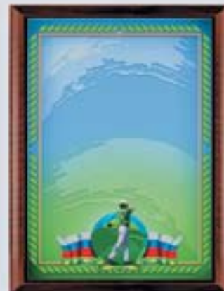
PL315a 31x23 см <CR> PL315b 20,5x15,5 см <CG> ГОЛЬФ