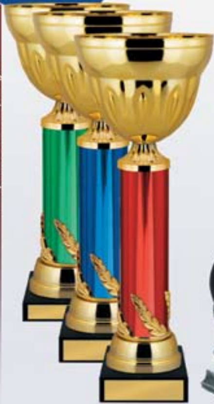
KM952a 31,5 см <CC> KM952b 29,5 см <CA> KM952c 26,5 см <BZ>