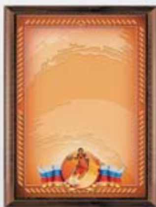
PL312a 31x23 см <CR> PL312b 20,5x15,5 см <CG> БАСКЕТБОЛ