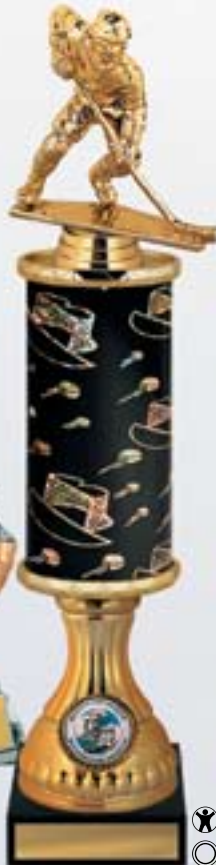
PS606a 41,5 см -5 -B <CD> PS606b 39,5 см -5 -B <CC> PS606c 37,5 см -5 -B <CB>