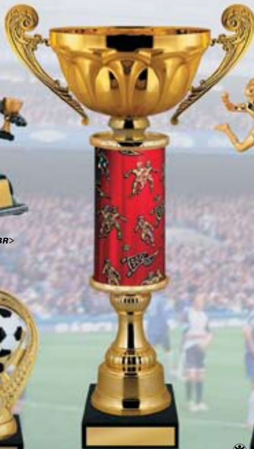
KM938a 47 см <CQ> KM938b 45 см <CP> KM938c 41,5 см <CM>