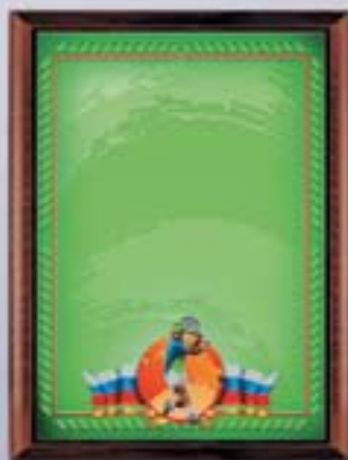
PL318a 31x23 см <CR> PL318b 20,5x15,5 см <CG> ТЕННИС