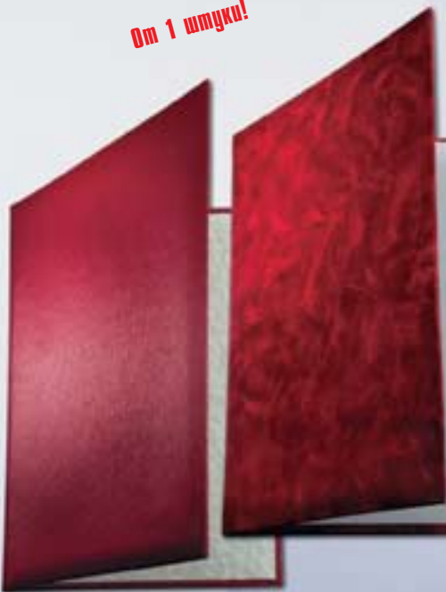
AP5 31x22 см <BR> бумвинил "Шелк"/ бумвинил