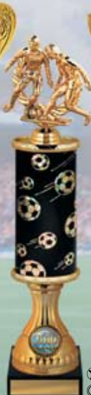
PS607a 40,5 см -5 -B <CF> PS607b 38,5 см -5 -B <CE> PS607c 36,5 см -5 -B <CD>