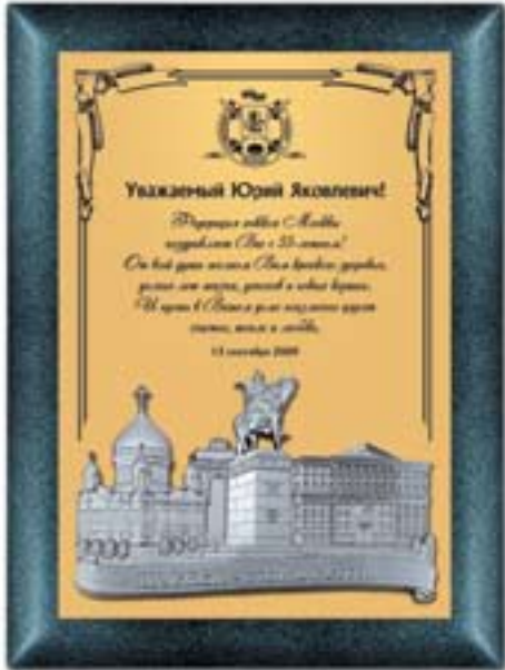
PL309 30,5x22,5 см <DA> коллаж "Москва" на основе "Графит"