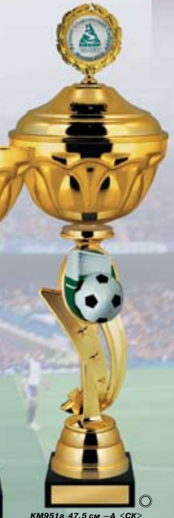
KM951a 47,5 см -A <CK> KM951b 45,5 см -A <CJ> KM951c 42 см -A <CF>

Цены кубков (призов) указаны с установленными фигурами и плоскими металлическими вкладышами