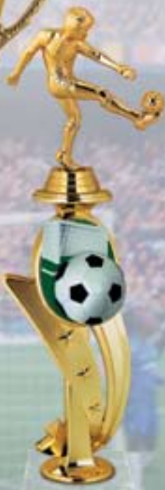
PS608 32 см —4 <BW>